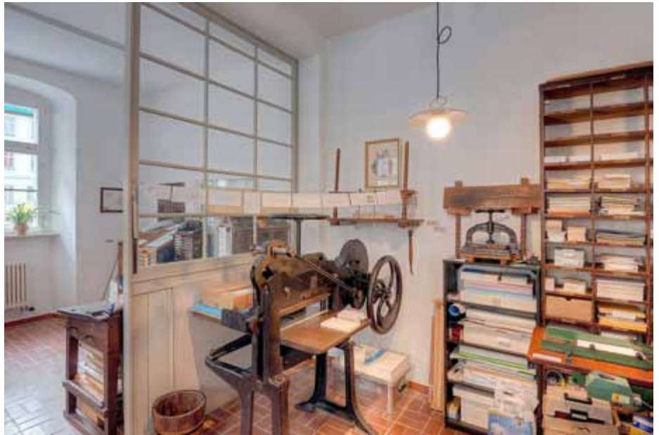
Die neugestalteten Räume der historischen Schaudruckerei werden fachkundig belebt.

Karten und Voranmeldungen in der Touristinformation im Lutherhaus (Tel.: 036481 85 121).