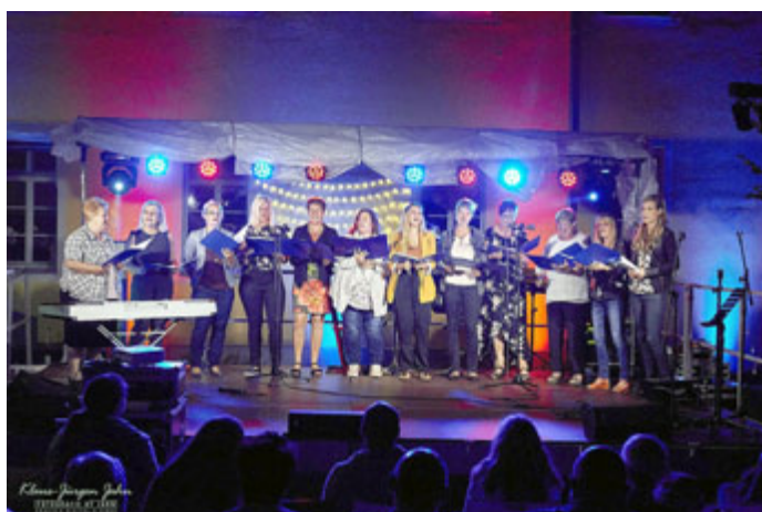
Der Lehrer- und Erzieherchor der Schillerschule