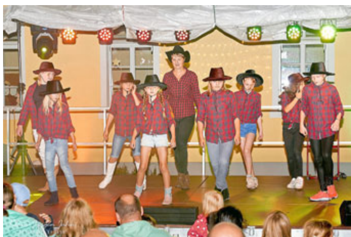
Die Line-Dance Gruppe der Schillerschule