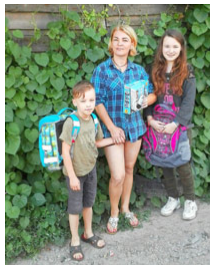
eine beschenkte Familie in Shitomir

Shitomir mitgenommen werden. Dort stand den direkt beschenkten Schulanfängern die Freude regelrecht ins Gesicht geschrieben. Natürlich standen auch wieder die Besuche und Gespräche mit den Familien der Besuch des Kinderheims in Deneschi auf dem Plan. Sorgen, Ängste und Nöte wurden dort bekannt, die es für uns in Deutschland oft gar nicht so gibt. Ein Informationsabend dazu findet im November statt (Termin siehe Aushang).