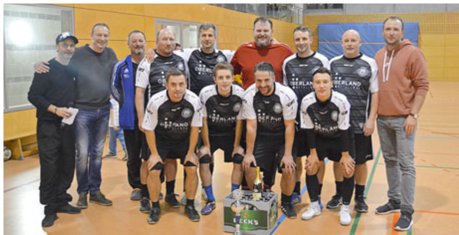
Das Trainer-Team nach der Siegerehrung