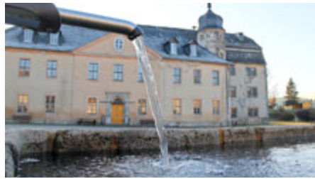
Knau Rittergut.

von Baumgruppen und einer Grabanlage entsprechend der Freimaurersymbolik, die sich bis heute erhalten hat.