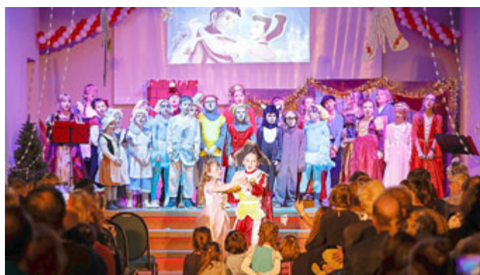
Die Laienspielgruppe der Schillerschule