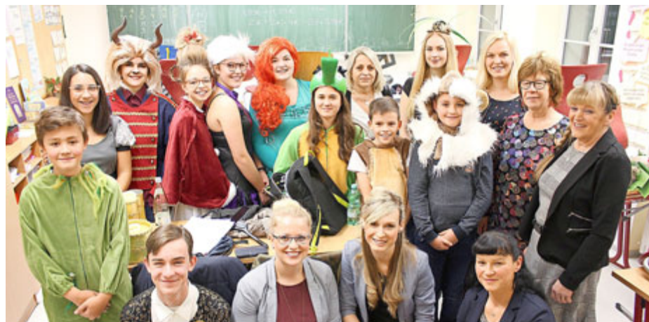
Ehemalige Laienspieler mit dem aktuellen Team der Laienspielgruppe