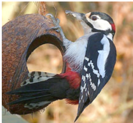
Buntspecht an der Fütterung.

In ganz Deutschland ist man den Wintervögeln auf der Spur. Bei Kälte und Schnee