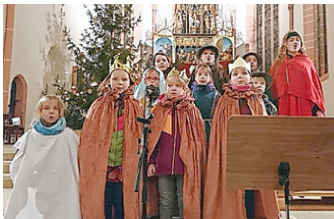
der Kinderchor Neustadt zum Krippenspiel 2019

Ohne die vielen Ehrenamtlichen in den Chören, die Bläser, die Krippenspieler und alle, die „hinter den Kulissen“ an den Vorbereitungen und an der Durchführung der Gottesdienste beteiligt waren, wären diese nicht möglich.