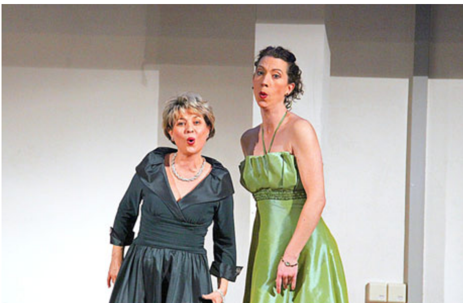
Musikerinnen des „Trio Frauenrausch“

Doch selbstverständlich gab es auch wieder eine Vielzahl von städtischen kulturellen Veranstaltungen, zu denen tausende Besucher den Weg gefunden haben. Ganz vorn sicherlich unser Brunnenfest oder die Veranstaltungen im Rahmen unseres Neustädter MusikSommers. Aber auch Vorträge, Führungen, Konzertveranstaltungen, Lesungen, Ausstellungen, Tag des offenen Denkmals, Reformationstag,