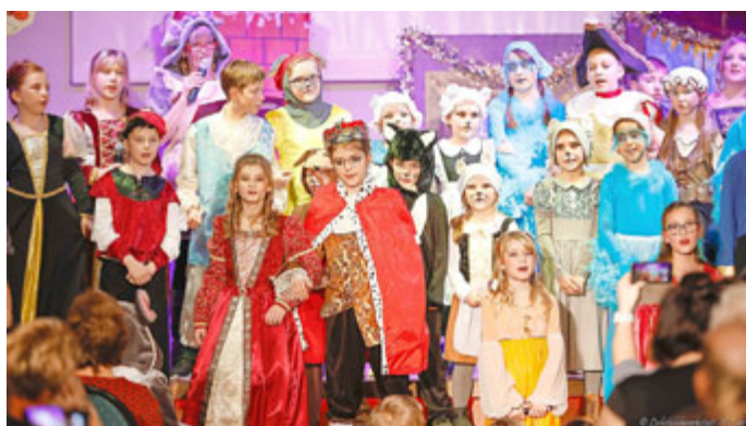
Dieses Jahr wurde das Stück „Cinderella“ aufgeführt