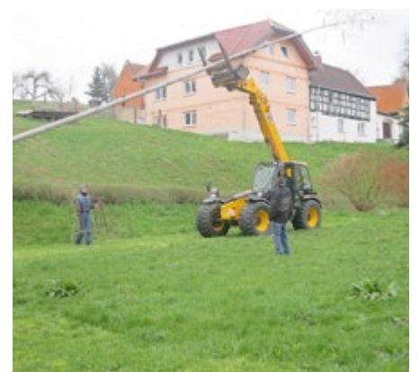
Der Baum bewegt sich nach oben