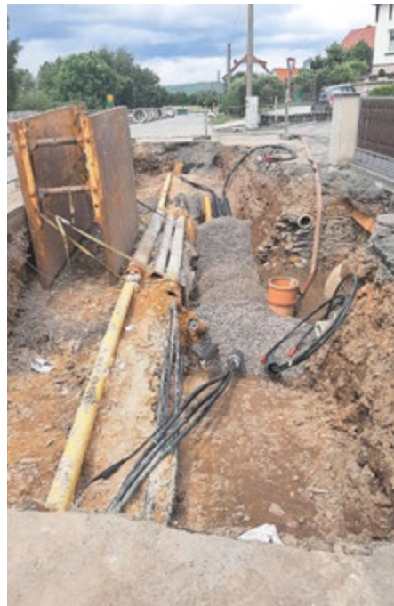
Umverlegung der Gas- und Elektroleitungen