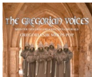
© muhsik agentur Ltd. & Co. KG

Karten für diese Veranstaltung der Kirchgemeinde Neunhofen im Pfarramt Neustadt, Kirchplatz 2.