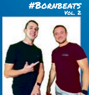
#BORNBEATS VOL. 2