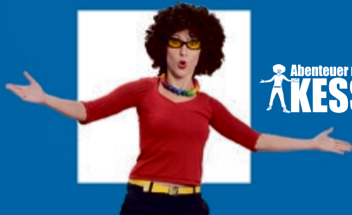
Abenteuer mit KESS

Karten in der TouristInfo Neustadt (Orla) | Tel. (036481) 85 121 www.neustadtanderorla.de