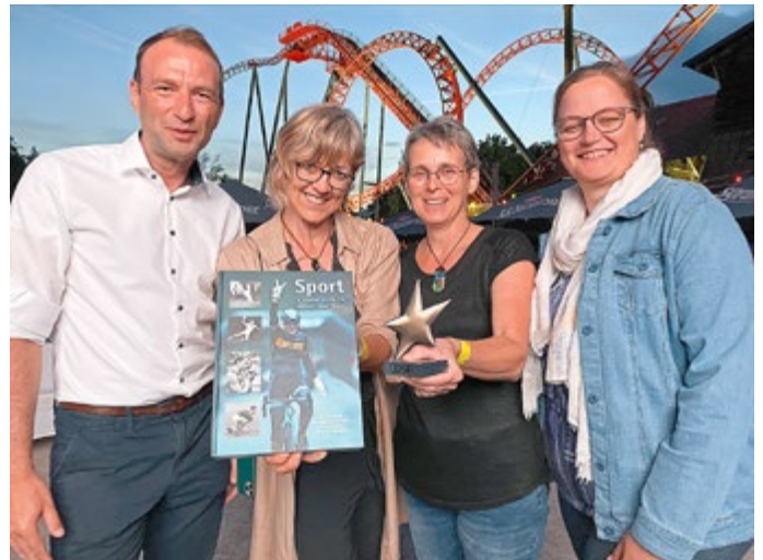
Team zur Preisverleihung von „Sterne des Sports“