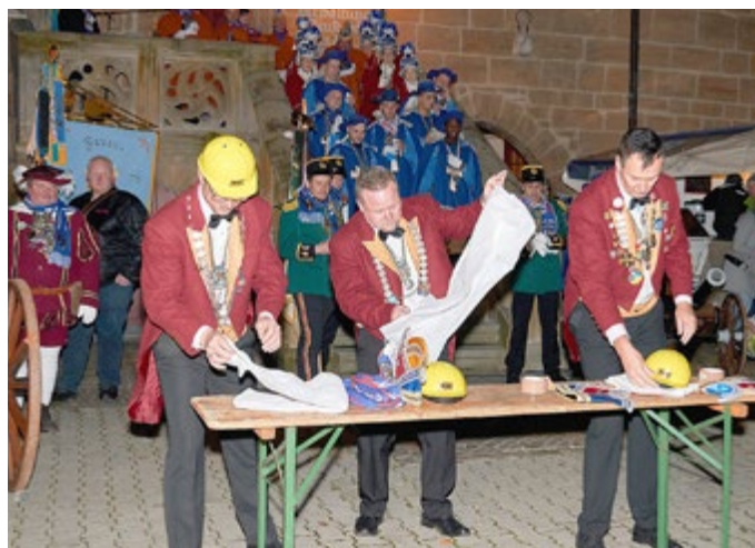
Kampf um den Rathauschlüssel am 11.11. um 17.11 Uhr