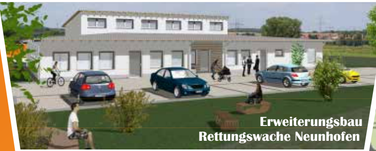
Erweiterungsbau Rettungswache Neunhofen