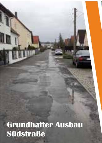
Grundhafter Ausbau Südstraße

27. Januar 2024 | Jahrgang 35 | Nummer 2