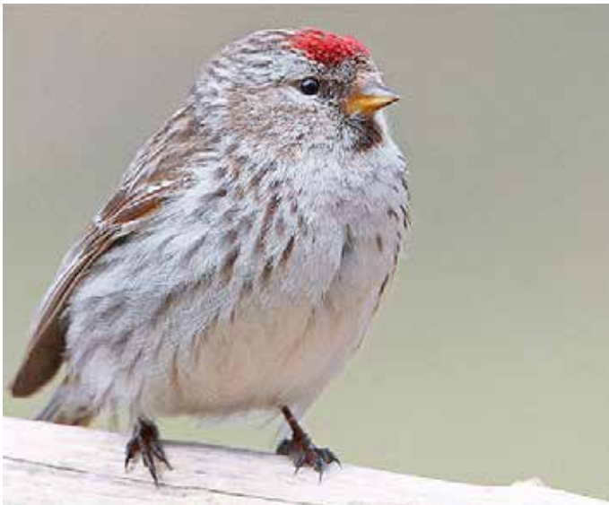
Der gesellig lebende Birkenzeisig mit karminroter Stirn aus Skandinavien frisst gern Samen von Birken, Erlen oder Gräsern und Kräutern.

In diesem Jahr wurden im Vergleich zu 2023 zum Beispiel mehr Buchfinken, Eichelhäher, Wintergoldhähnchen und Buntspechte gemeldet. Die klirrende Kälte in Teilen Ost- und Nordeuropas war sicher auch ein Grund dafür, dass Birkenzeisige als Wintergäste in Thüringen auftraten und auch noch in der letzten Januarwoche mit einem Schwarm von zirka 100 Vögeln bei Neustadt beobachtet wurden.