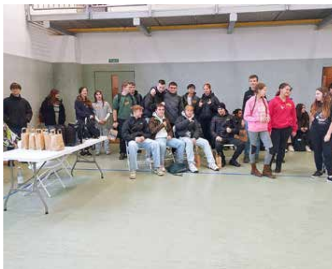
Vor der Vergabe der Präsente