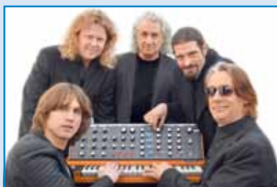
OPEN AIR mit der Stern-Combo-Meißen