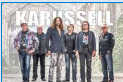
OPEN AIR mit Karussell