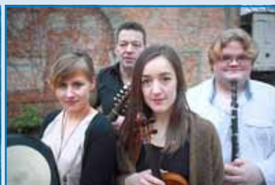
NUA (Irish & Scottish Folk)