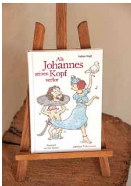
„Als Johannes seinen Kopf verlor“