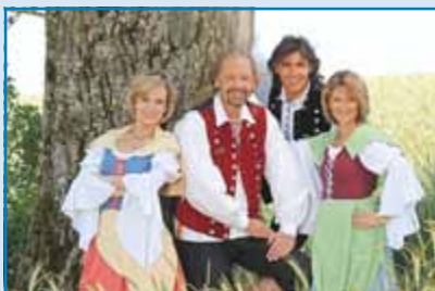
Musik mit den Schäfern