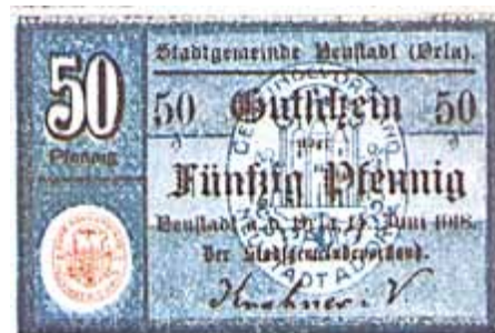
Die Ausgabe der blauen Scheine, gefertigt von der Firma Henning in Greiz, erfolgte im Juli 2018.

scheint. Da die von der Stadt zuerst ausgegebenen Scheine keine große Haltbarkeit aufwiesen, dürfte zu erwägen sein, ob die Stücke wieder aus Papier oder aus Metall herzustellen sind. Der Gemeinderat entscheidet sich für die Herstellung von weiteren 20 000 Stück Papiergeldscheinen. Es soll haltbareres Papier benutzt werden, außerdem sollen sie noch mit einem Vermerk über die Gültigkeitsdauer (bis 31. Dez. 1920) versehen werden.“