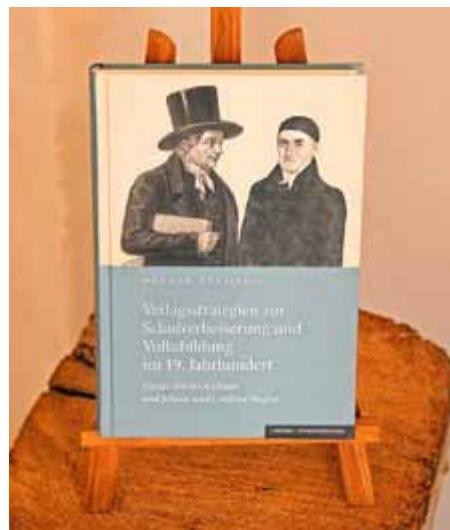
„Verlagsstrategien zur Schulverbesserung und Volksbildung im 19. Jahrhundert“