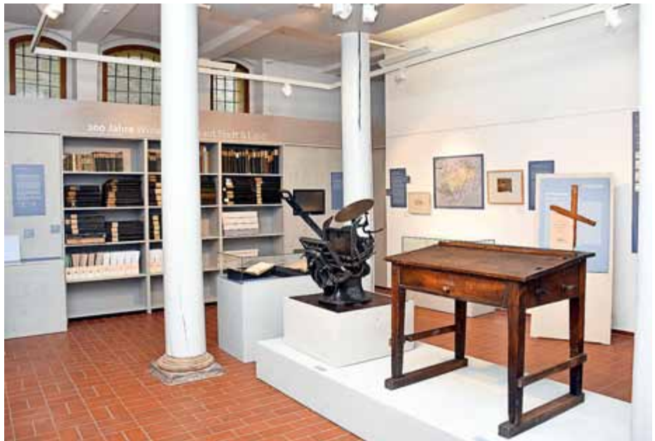
Blick in die aktuelle Sonderausstellung im Museum für Stadtgeschichte

Um 1450 erfand Johannes Gutenberg eine Druckmaschine und löste somit die handschriftliche Produktion von Büchern im Mittelalter ab.