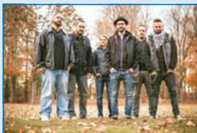
OPEN AIR mit den Escandalos