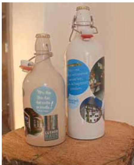
Steingut-Flaschen mit verschiedenen Neustadt-Motiven