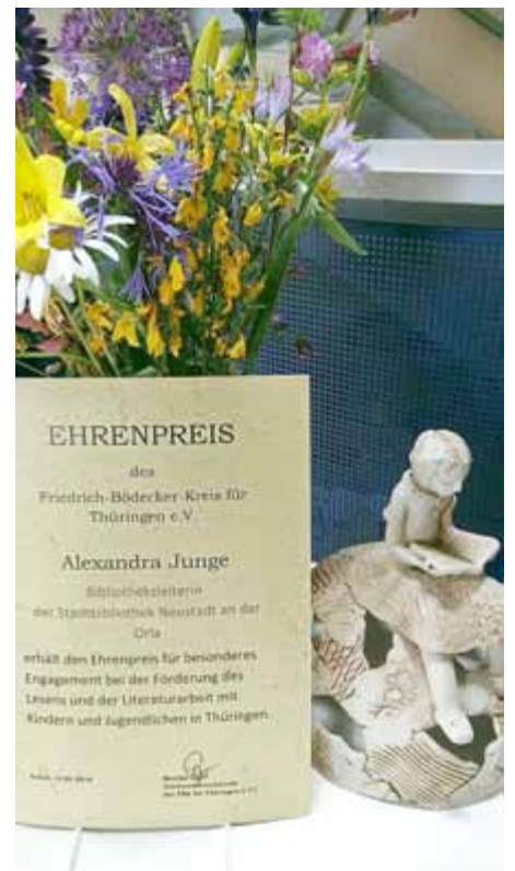
Ehrenpreis mit individuell gestalteter Keramik, die ein lesendes Mädchen zeigt

Für den FBK für Thüringen ist Alexandra eine wichtige Partnerin, eine zuverlässige