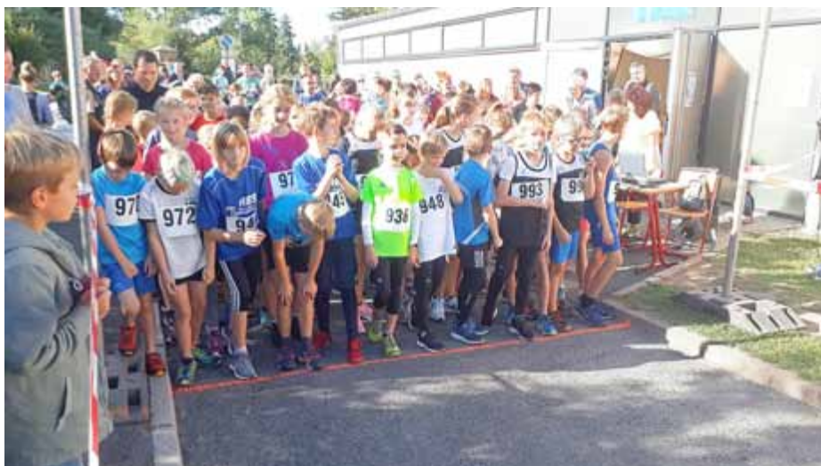
Start zum 1,6km-Lauf in Ranis