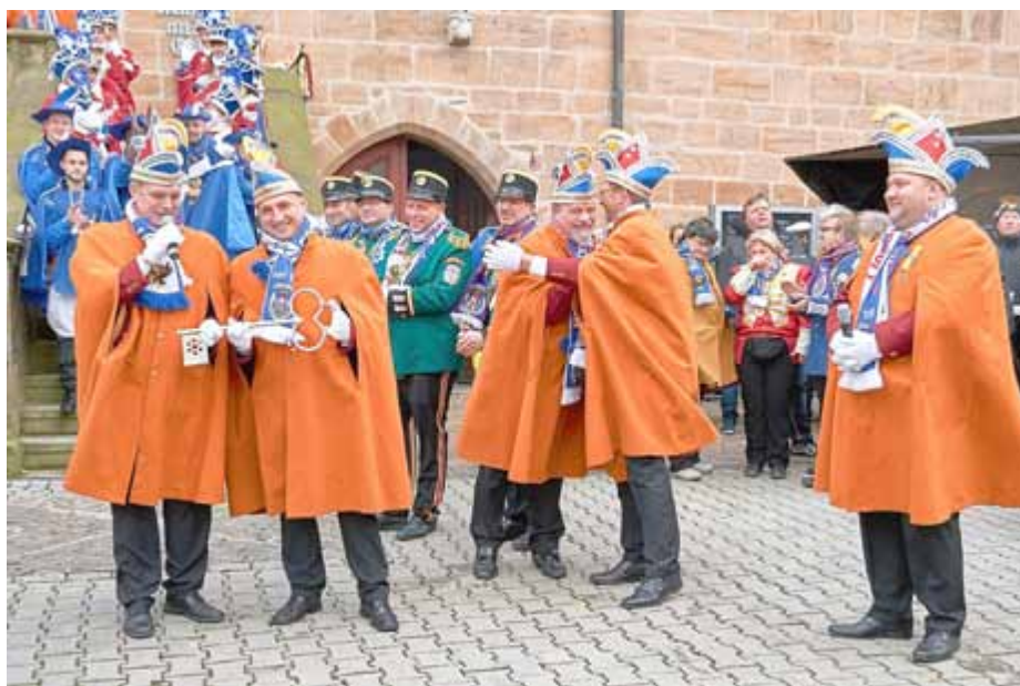
Ausgelassene Stimmung zum Schlüsselwettkampf auf dem Duhlendorfer Marktplatz

Endlich hat die Zeit des Wartens ein Ende, denn schon bald beginnt wieder die 5. Jahreszeit und Neustadt erwacht wieder zu Duhlendorf. Am 11.11.2018 pünktlich um 11.11 Uhr begrüßt die Karnevalsgesellschaft Duhlendorf ihre Gäste auf dem Neustädter Marktplatz. Auch in diesem Jahr darf man wieder gespannt sein, wer den Kampf um den Rathauschlüssel für sich entscheiden wird. Bereits seit einigen Wochen wird der Schlüsselwettkampf mühevoll vorbereitet, um den Gästen ein abwechslungsreiches Programm zu bieten.