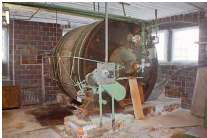
Ein gut erhaltenes Gerbfass.