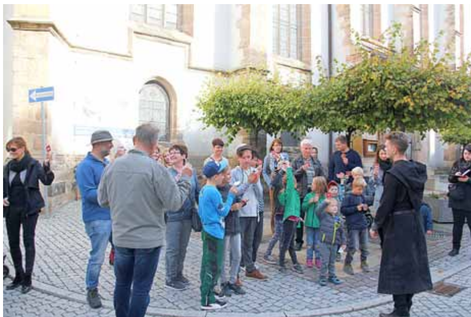
Die rote Dohlenkarte entlarvte so manche Flunkereien entlang des Rundgangs

streit wurden die Teilnehmer mit einem Lutherhaus-Button ausgezeichnet.