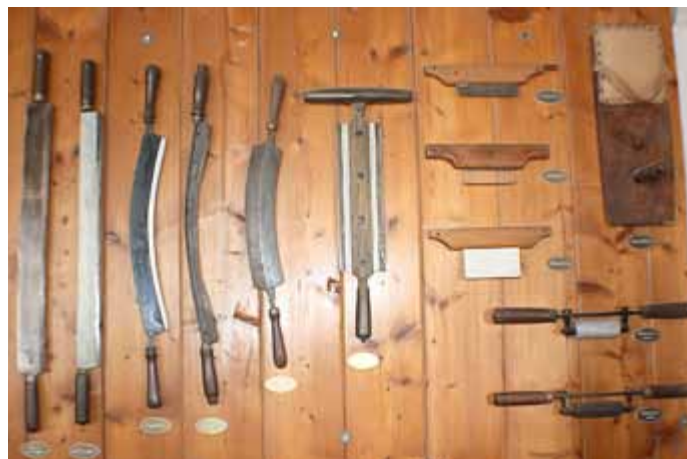
Einige Werkzeuge der Gerber.