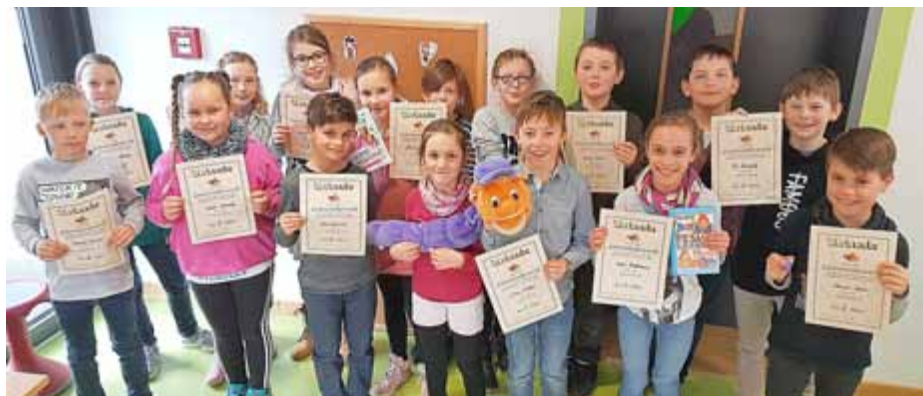
Die Teilnehmer und Jurymitglieder des diesjährigen Lesewettbewerbs