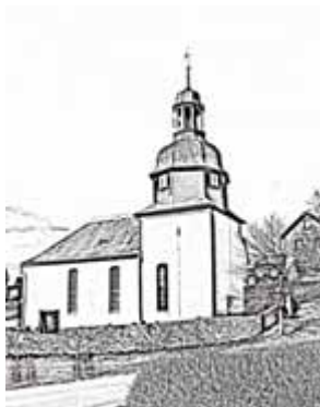
Kirche in Bucha

Wir laden alle herzlich ein zum Regionalgottesdienst am Sonntag Kantate (19. Mai) um 10.00 Uhr mit in die Kirche nach Bucha zu kommen. Mit Chören und dem Musizierkreis aus unserer Region. „Kantate“ heißt „singen“ - und davon wollen wir in diesem Gottesdienst reichlich Gebrauch machen.