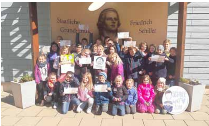
Der Schülerchor nimmt die Urkunde „Schule mit Herz“ entgegen