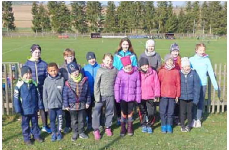
Teilnehmer/innen vom TSV „Germania 1887“ e.V.