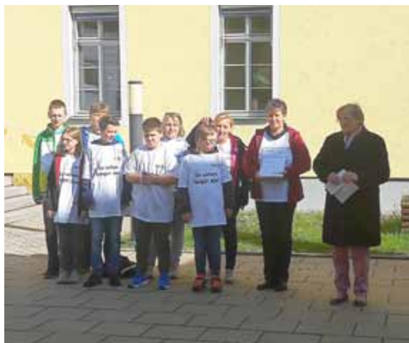
Ehrung des Projekts „Gemeinsam sind wir stark“