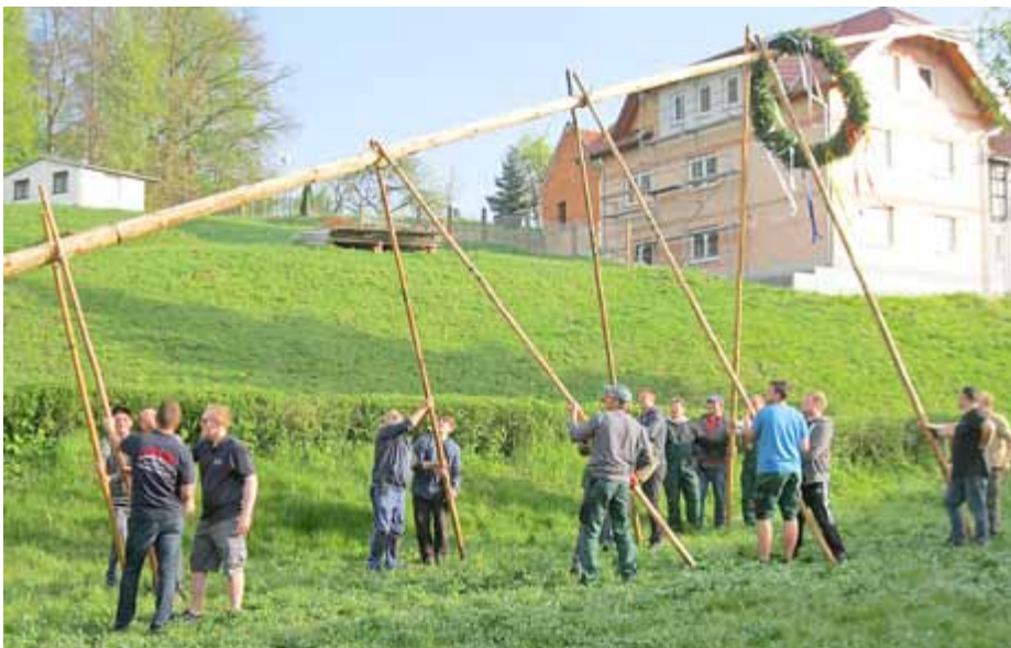
Jetzt wird die gemeinsam Kraft aller gebraucht

Die Waldgeistgemeinde Breitenhain hat traditionell am 30.4. ihren Maibaum aufgestellt. Da am alten Baum der Zahn der Zeit genagt hatte, musste in diesem Jahr ein neuer Stamm besorgt werden, wofür die Männer der Freiwilligen Feuerwehr sorgten. Unterstützt von weiteren Dorfbewohn-