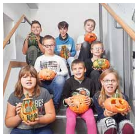
Praktischer Tag zum Thema „Halloween“ (Projekt „Gemeinsam sind wir stark“)