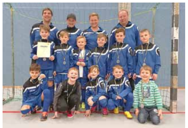
Erfolgreiche F-Junioren und das stolze Trainerteam