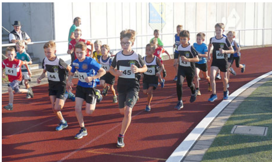
Viertelstundenlauf der Jungen in Pößneck

Eine Woche später wurde mit dem 25. Limberglauf in Ranis bei herrlichem Wetter ein weiterer Wertungslauf im Saale-Orla-Läuferpokal 2019 ausgetragen. Anders als beim Stadionlauf in Pößneck mussten die Teilnehmer hierbei je nach Distanz ei-