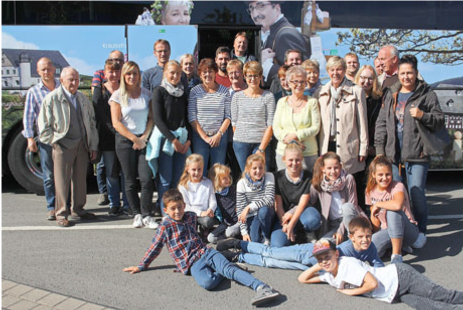
die Breitenhainer am Bus in Gotha