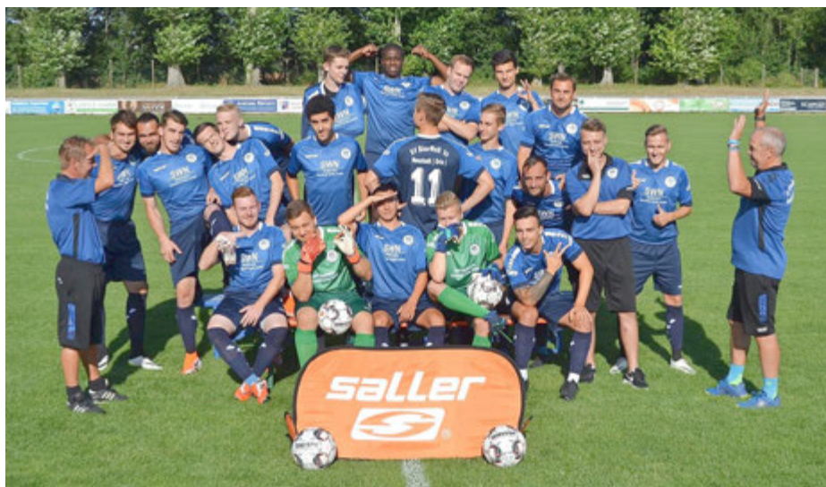
„Meister“ der nun abgebrochenen Saison 2019/2020: Die Erste Mannschaft des SV „Blau-Weiß `90“ e.V.

Wohlwissend, dass ab der neuen Saison kein „Kredit“ in die Spiele mitgenommen werden kann, wollen die Blau-Weißen mit dem Saisonziel, um die oberen Plätze mitzuspielen, die Spielzeit in Angriff nehmen.