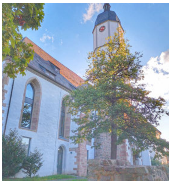
Dieses Foto sandte Annette Kempfert und gewinnt einen Neusta(R)dt-Gutschein.