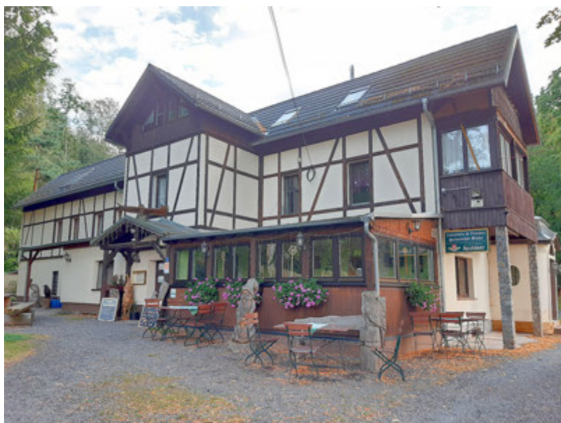
Dieses Foto sandte Anke Staps und gewinnt einen Neusta(R)dt-Gutschein.