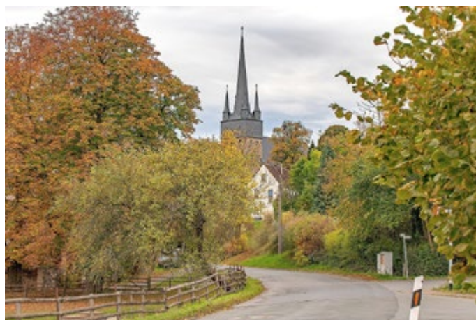
Konstantin Gruner: heutiges Foto zu Fabers Ansicht

am 27. Juni eröffnet und ist voraussichtlich bis zum 12. September 2021 zu sehen. Aufgrund der derzeitigen Situation soll die Ausstellungseröffnung am Sonntag, den 27.06. anders als sonst in einem mehrstündigen Zeitraum ab 14.00 stattfinden. Zu folgenden Zeiten würden wir uns freuen, Sie als Gäste begrüßen zu dürfen: