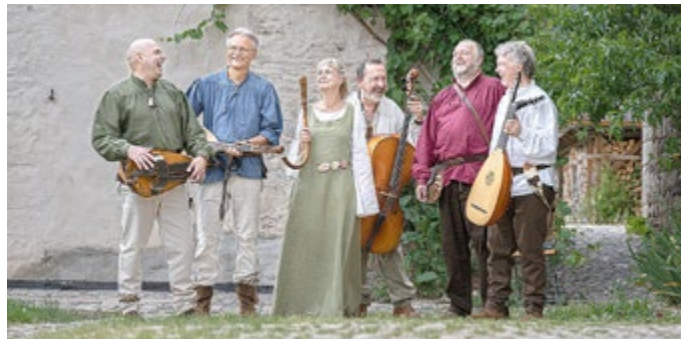
Die Gruppe Eulenspiegel