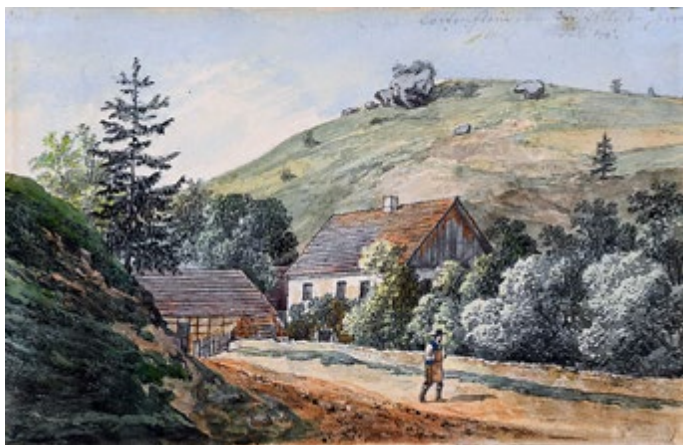
Mühlengrund mit Totenstein, 1848, Aquarell, Museum Georg Schäfer Schweinfurt, MGS 3567 A.