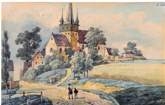
Kirche St. Simon und Judas in Neunhofen, undatiert (wohl 1820), Aquarell, Museum Georg Schäfer Schweinfurt, MGS 3556 A.