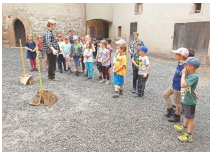
Exkursion zur Burg Ranis