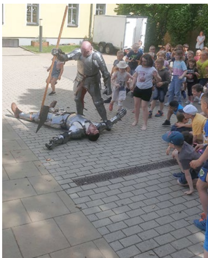
Schaukampf der Ritter auf dem Schulhof