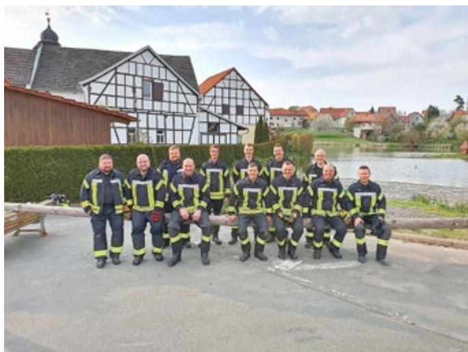
Belastungsprobe für den Maibaum

Am 30. April konnte in Lichtenau das Veranstaltungsjahr 2022 gestartet werden. Nachdem zwei Jahre der Maibaum erst verspätet gesetzt werden konnte, fand nun zum traditionellen Termin das Maibaumsetzen mit anschließendem Hexenfeuer statt. Bevor die Kameradinnen der Freiwilligen Feuerwehr Lichtenau den Baum in die Höhe stemmten, wurde eine Belastungsprobe durchgeführt, denn im Jahre 2009 war schon einmal ein Baum beim Aufstellen gebrochen.