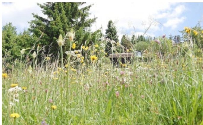
Eine artenreiche Wiese, die für den Arten- und Klimaschutz einen besonderen Beitrag leistet.

Unter neutraler Betrachtung wird deutlich, dass es sich auch bei Kleinstflächen um Monokulturen handelt. Unerwünschte Arten werden so aus dem „Pflegeobjekt“ verbannt. Es gibt zahlreiche fachliche Hinweise, wie unerwünschte Kleesorten aus dem Rasen vertrieben werden können, an Stelle mehrere Arten einer Pflanzengesellschaft im Garten zu etablieren. (Quellen: 2, 3, 4)