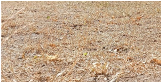
Derartige Bereiche besitzen keinerlei Puffervermögen bei Wind und Regen, sondern sind eine CO 2 Quelle, die nicht zum Klimaschutz beiträgt.

Beachten wir die Grundlagen des Klimaschutzes, so sollte uns klar werden, dass 75% der Flächen Europas nicht aus Waldarealen bestehen. Vielfach bestehen die Flächen aus Siedlungs- und Landwirtschaftsflächen. Besonders funktionelle Grünflächen, die intensiv genutzt werden, haben eine enorme CO 2 Speicherfähigkeit. (Quelle: 1)