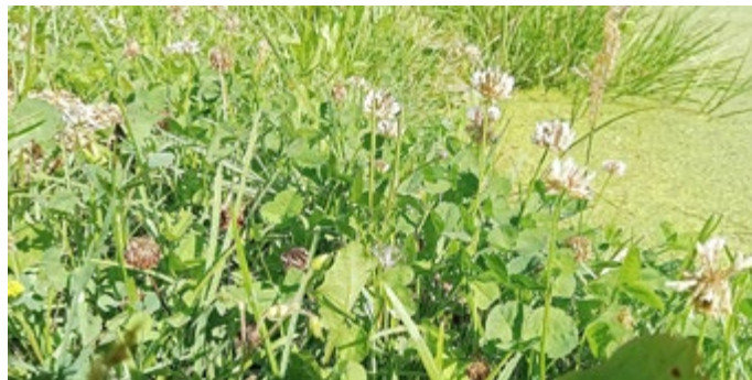
Weißklee inmitten einer Grünfläche am Dorfteich Knau

Bis zum Ende des Zweiten Weltkrieges war es gängige Praxis, verschiedene Kleesorten als Zwischenfrüchte oder in die Grasmischungen einzubringen. Nach dem Krieg setzte sich ein Trend durch, der den Klee aus den Mischungen der Gärtner verbannen sollte. (Quelle: 5)