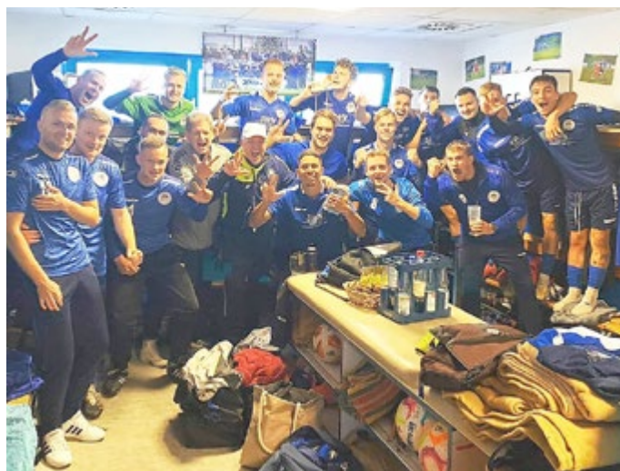
Nach dem Heimsieg gegen Jena Schott II: Der Jubel der Ersten Mannschaft in der Kabine