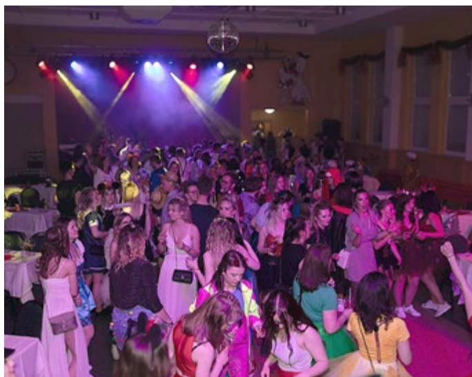
Kostümball der 61. Session