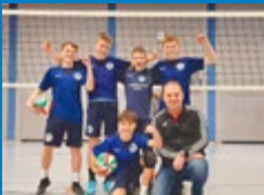
Volleyballer auf 1. Platz