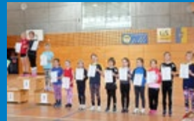
Neustädter Hallenmeister- schaften