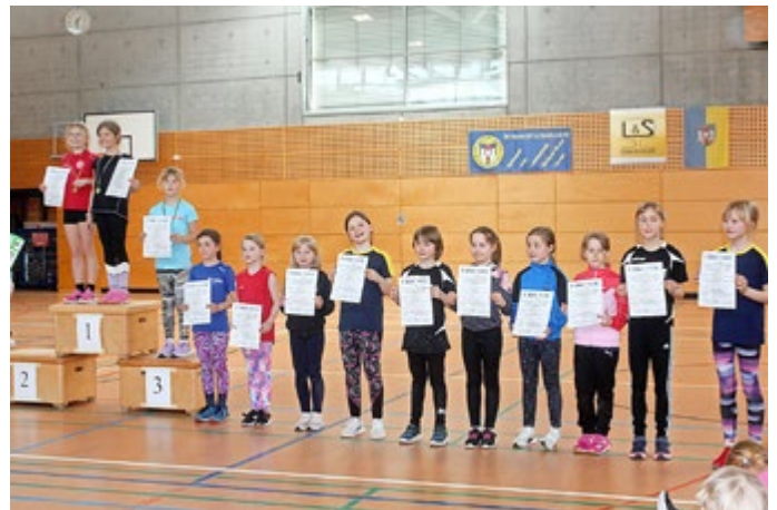
Siegerehrung der Altersklasse 9 weiblich