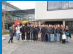
Schüler im Thüringer Landtag