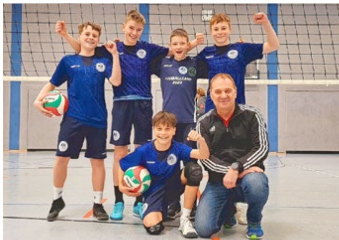
Volleyball-Schulenauswahl Orlatal-Gymnasium Neustadt

Den ersten Platz im Volleyball-Kreisfinale WK IV (Schüler der 6./7. Klasse) ging an das Orlatal-Gymnasium Neustadt. Im ersten Spiel gegen die Regelschule Oppurg siegten sie 2:1 (25:17, 21:25, 15:8). Auch das zweite Spiel gegen das Gymnasium Pößneck endete mit 2:0 (25:14, 25:4). Das dritte Spiel gegen die Regelschule Hirschberg endete ebenso mit 2:0 (25:10, 25:6). Endstand: 1. Gymnasium Neustadt, 2. Regelschule Oppurg, 3. Gymnasium Pößneck, 4. Regelschule Hirschberg.