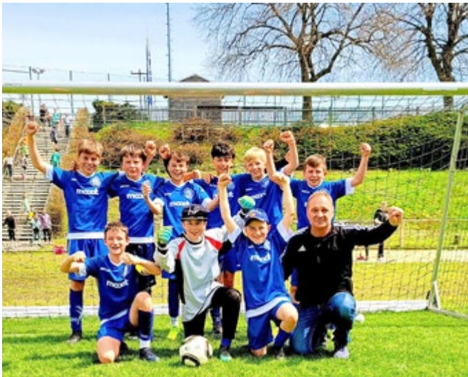
Schulenauswahl Orlatal-Gymnasium Neustadt

Einen historischen Sieg errungen im Ostthüringen-Finale Fußball die Jungen der 5. und 6. Klasse des Orlatal-Gymnasiums. Im ersten Gruppenspiel gegen das Gymnasium Eisenberg blieb es bei einem 0:0. Im zweiten Gruppenspiel erreichten sie ein 2:1 und damit den Sieg gegen das Angergymnasium Jena, wobei die Neustädter erst in der letzten Minute ausgleichen konnten und in der Nachspielzeit den Siegtreffer erzielten. Im Halbfinale dann ein dramatischer Sieg in letzten Minute gegen die bärenstarken Jungs des Friedrichsgymnasium Altenburg. Im Finale folgte ein hart erkämpfter Sieg mit 1:0 gegen das Gymnasium Eisenberg. Endstand: 1. Orlatal-Gymnasium Neustadt, 2. Schiller-Gymnasium Eisenberg, 3. Friedrichsgymnasium Altenburg, 4. Liebe-Gymnasium Gera, 5. Gymnasium Weida, 6. Angergymnasium Jena. Zum ersten Mal in der Geschichte des Orlatal-Gymnasiums gelang so ein Sieg im Ostthüringen-Finale der WK IV im Fußball. Damit gehören die Jungs des Neustädter Gymnasiums schon jetzt zu den sechs besten Schulauswahlmannschaften im Fußball der 5. und 6. Klasse der WK IV und kämpfen nun im Landesfinale um den Meistertitel in Thüringen. Ein großer Erfolg auch für Blau-Weiß Neustadt, denn alle Spieler, außer Kilian Müller (FC Carl Zeiss Jena), spielen beim Neustädter Verein Fußball.