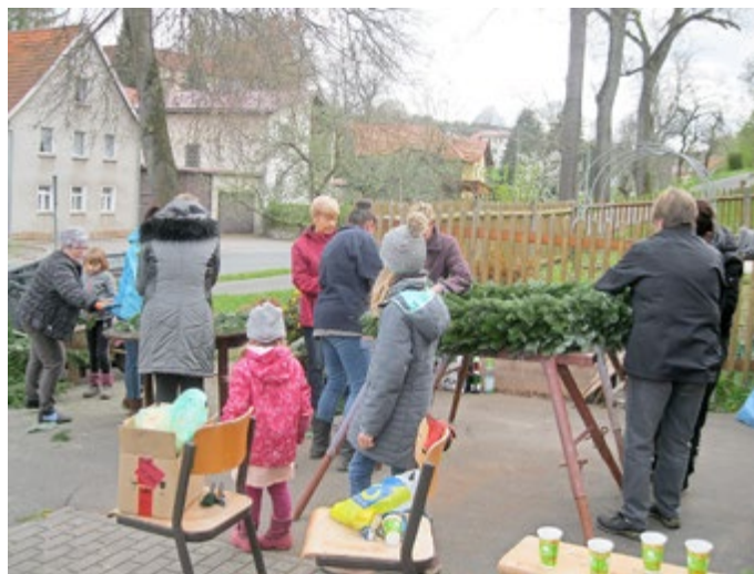
Arbeitsteilung beim Kranzbinden