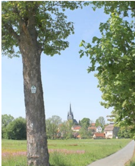
Heimat der Neunhöfner?

In der Ausgabe 15/2023 des Neustädter Kreisboten eröffnete der „Freunde der Stadtbibliothek Neustadt an der Orla e. V.“ auf Basis einer archivalischen Untersuchung die Frage, wie eigentlich die Einwohner Neunhofens genannt werden sollen, insofern aus diesem bis 1994 selbständigen Ortsteil Akten mit vier verschiedenen Varianten überliefert sind: Neunhofer, Neunhöfer, Neunhofener und Neunhöfener. Inzwischen gibt es eine Rückmeldung. J. Zimmermanns Argumentation für eine fünfte Variante, „Neunhöfner“, wird wie folgt zusammengefasst: