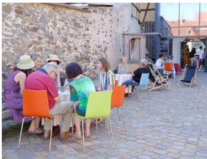
Das Lutherhaus-Café war durchweg gut besucht

Der Bismarckturm-Verein gestaltete dieses Jahr das aus Führungen und Vorträgen bestehende Programm gemeinsam mit den Herren des Alten Rats und dem amtierenden Brunnenmeister. Zum Start wurde am frühen Nachmittag der in Kooperation mit der Stadtverwaltung neu gestaltete Spielplatz eröffnet. So waren die Voraussetzungen ideal für einen kurzweiligen Familiennachmittag, sodass die Veranstalter letztlich 90 Besucher zählen konnten.