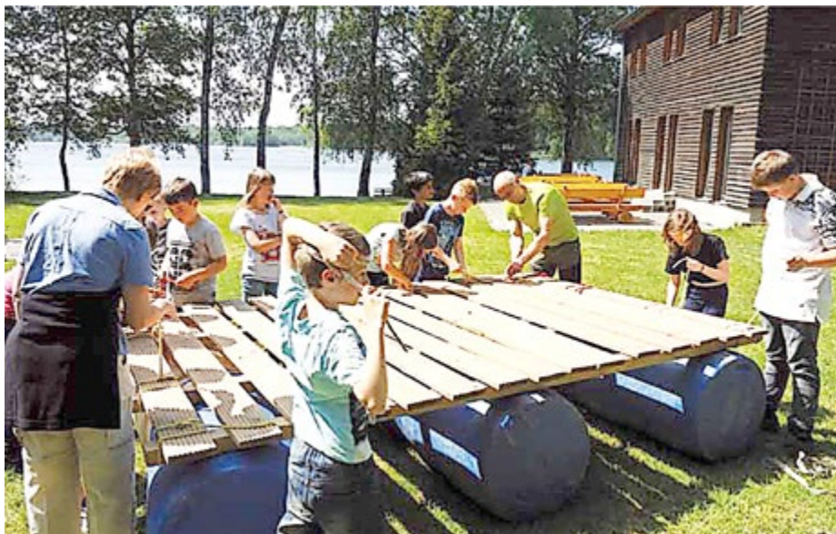
Familienerlebnistag an der Jugendherberge Plöthen

www.thueringer-schiefergebirge-obere-saale.de