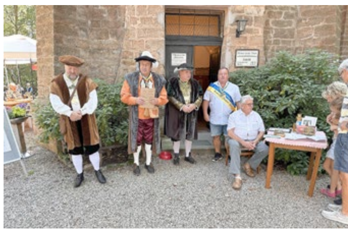
Der Brunnen- und der Bismarckturm-Verein gestalteten gemeinsam den Nachmittag auf dem Kesselberg