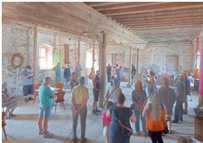
Zahlreiche Führungsteilnehmer im Festsaal des Ritterguts Knau

Der bundesweit von der Deutschen Stiftung Denkmalschutz ausgerichtete Tag des offenen Denkmals lockte auch in Neustadt und Umgebung viele neugierige Menschen zu den verschiedenen Angeboten.