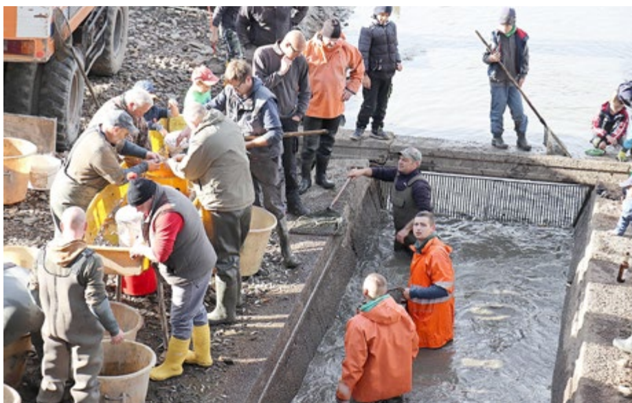
Abfischen der Teiche