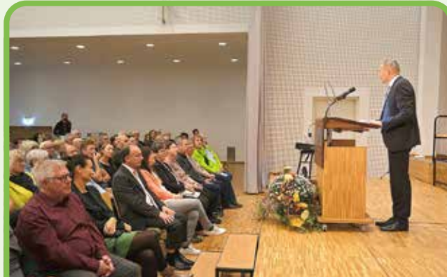
Bürgermeister Ralf Weiße bei der Festansprache