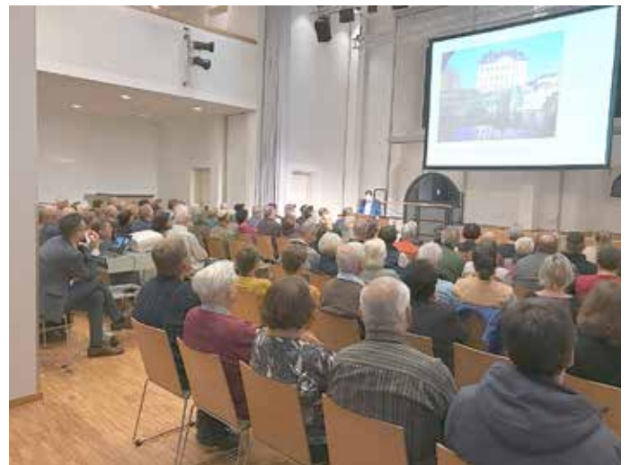
Mit etwa 100 Zuhörern war der AugustinerSaal erneut gut besucht.