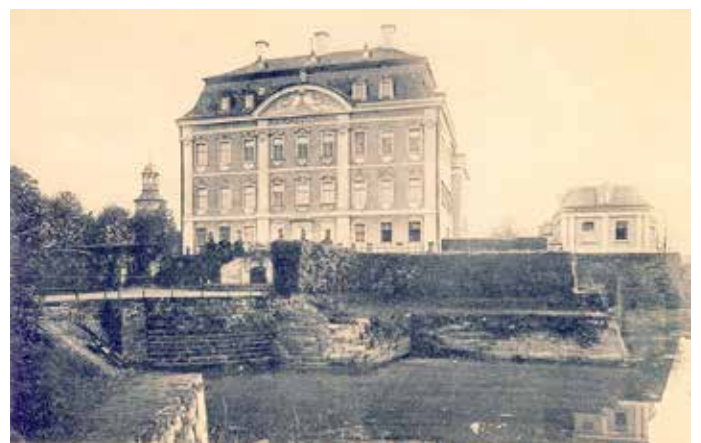
Mit historischem Bildmaterial konnte der Referent seine Ausführungen anschaulich machen.