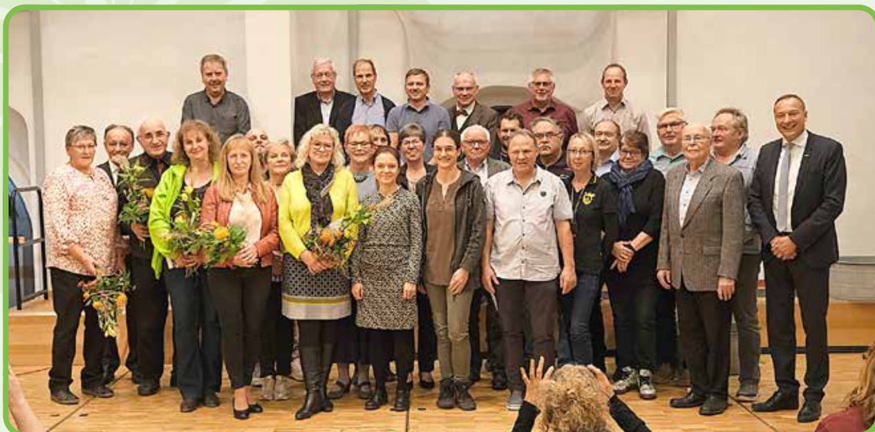
Alle 29 Geehrten

Die Stadt Neustadt an der Orla kann sich dankbar schätzen über diese großartige Kraft, dieses außergewöhnliche Tun und diese wunderbaren Menschen, die zum Wohle der Bürgerinnen und Bürger dieser Stadt agieren.