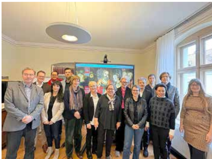
Vertreter der 14-Cranach-Städte zur Präsentation der neuen Homepage

Die neue Homepage schlägt eine Brücke zwischen Touristik und Kunstwissenschaft, aber auch zwischen altmeisterlicher Kunst und zeitgemäßer Kunstvermittlung. „Denn die ‚Wege zu Cranach‘ sind vor allem neue Wege. Und Cranach - das ist ein ungeheurer Schatz mit vielen spannenden Antworten auf Fragen, die uns auch heute noch bewegen. Und den wollen wir gemeinsam mit unseren Kooperationspartnern aus den Cranach-Städten heben“, so Löw.