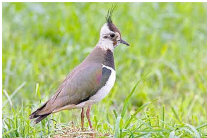
Kiebitz mit aufgestellter Federhülle.

Der Wiesenbrüter ist zum Vogel des Jahres 2024 gewählt worden - und er kann die Aufmerksamkeit gut gebrauchen. Da feuchte Acker- und Grünlandflächen im gesamten Land immer selte-