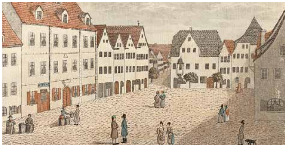
Im Gründungsjahr der Sparkasse befand sich im so genannten Kursächsischen Palais auf dem Markt (links im Bild) noch die Neustädter Apotheke. Nach dem Erwerb der Immobilie 1857 verlegte die Neustädter Sparkasse 1865 ihre Geschäftsräume in dieses Gebäude.

Die Sparkassen-Idee lag vor mehr als 200 Jahren gewissermaßen in der Luft und trat einen deutschlandweiten Siegeszug an.