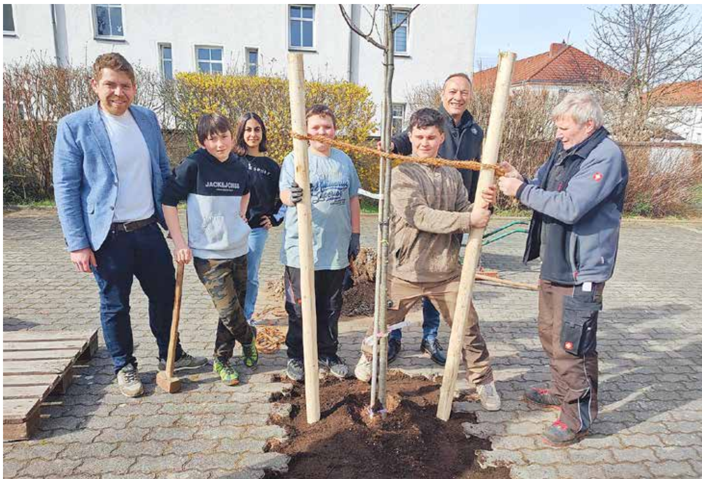
Die Schüler packten bei der Baumpflanzung kräftig an.

Wir drücken der Staatlichen Regelschule „Johann Wolfgang von Goethe“ die Daumen und hoffen, dass sie als einer von zehn Finalisten für die Umsetzung eines naturnahen, kindergerechten und grünen Schulhofs ausgewählt wird.