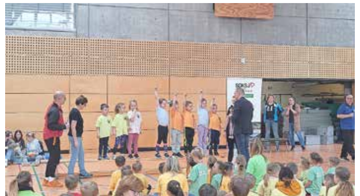
1. Platz für die „Kleinen Strolche“ des AWO-Kindergartens aus Neustadt