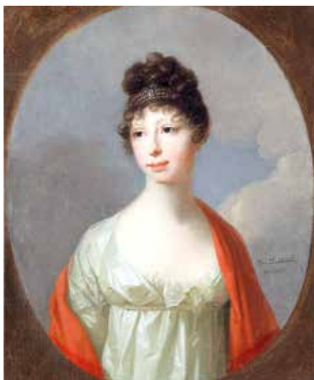
Maria Pawlowna (1786–1859), Großfürstin von Russland und seit 1828 Großherzogin von Sachsen-Weimar-Eisenach, war die Stifterin und Schirmherrin der Neustädter Sparkasse.

Mit dieser Ankündigung wurden im Januar 1823 die Gründung einer Sparkasse in Neustadt an der Orla und die damit verbundenen Ziele öffentlich gemacht. Neustadt war nach Weimar und Eisenach der dritte Standort einer solchen Institution in Thüringen überhaupt, noch vor Erfurt und Jena. Mit Hilfe einer Sparkasse wollte man in den schweren Jahren nach der napoleonischen Ära der Armut und sozialen Not in großen Teilen der Bevölkerung entgegen treten. Die Anregung dazu kam von höchster Stelle, von der Erbgroßherzogin Maria Pawlowna, der Schwiegertochter von Großherzog Carl August von Sachsen-Weimar-Eisenach.