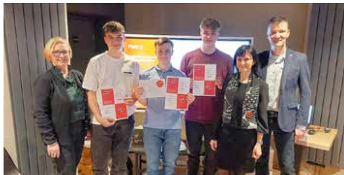
Die glücklichen Gewinner