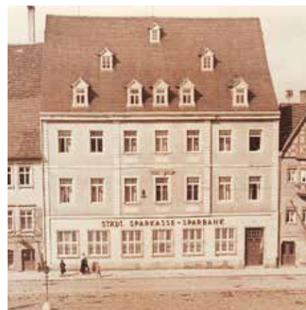
Das Sparkassengebäude 1938