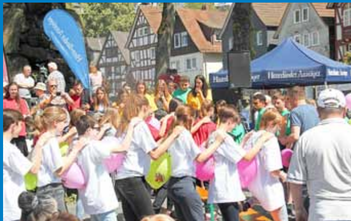
Raupenartig schlängelten sich unsere SchülerInnen mit Geschick und Teamwork durch den Parcours