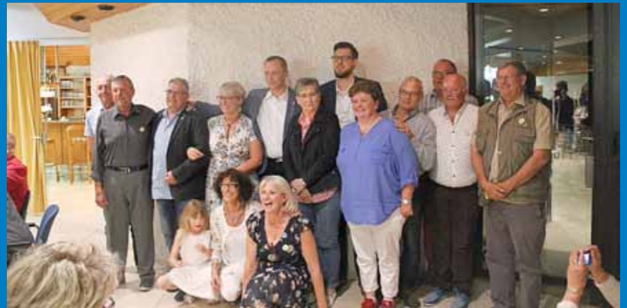
Die offiziellen Vertreter der fünf Partnerstädte