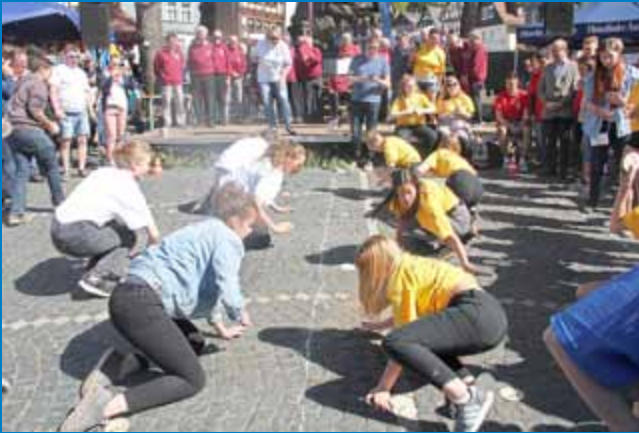
„Spiele ohne Grenzen“ auf dem Marktplatz