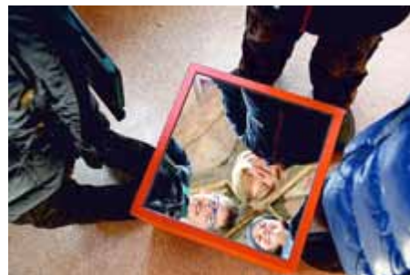
Lutherhaus für kleine und große Entdecker

Da die Teilnehmerzahl begrenzt ist wird um Vorbestellung gebeten. Karten für die öffentlichen Führungen sind in der Touris-