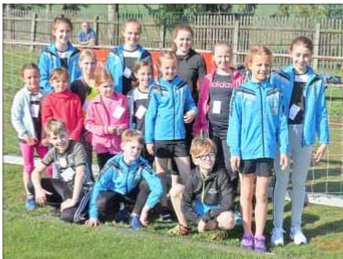
Teilnehmerinnen und Teilnehmer des TSV „Germania 1887“ e.V. Neustadt an der Orla