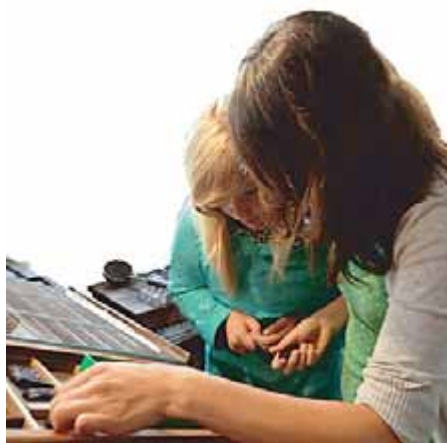
Schriftsätze selber gestalten im Museum für Stadtgeschichte

Minuten spielerisch, was es dabei mit den Beschreibstoffen „Papyrus, Pergament und Co.“ auf sich hat. Die Angebote für die Sekundarstufe I stehen ganz im Zeichen des Wandels „Vom Schriftsetzer zum Blogger“. Praktisch angelegt, können SchülerInnen am authentischen Ort eigene Schriftsätze anfertigen, Textbeiträge des Neustädter Kreisboten aus dem Archiv vergleichen und als rasende Reporter in der Neustädter Innenstadt auf die Suche nach dem besten Pressefoto gehen. Zwei öffentliche Kuratorenführungen am 10. Juni / 01. August 2018 sowie eine Kinder- und Familienführung am 09. Juni 2018 runden das Begleitprogramm ab. Als Abschlussveranstaltung findet am 30. August 2018 ein Gespräch mit regionalen Vertretern aus Presse und Journalismus statt. Dabei werden gemeinsam Aspekte der Redaktions- und Verlagsarbeit und Informationsvermittlung im Spiegel der Zeit diskutiert und in globalem Kontext eingebettet.