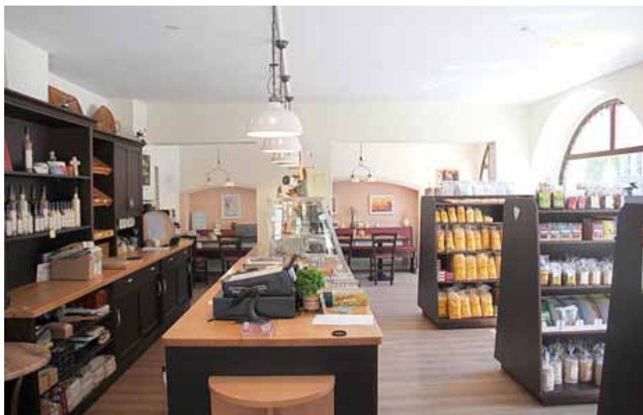
Blick hinein in den Mühlenwinkel