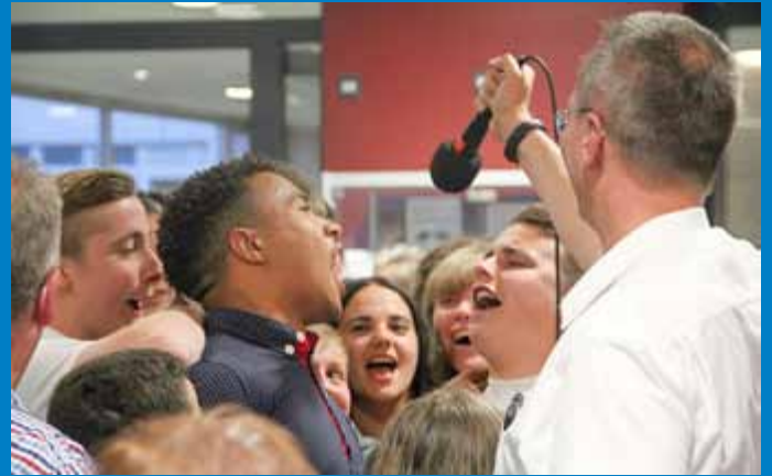
Die Sieger der Schülerwettkämpfe sangen ausgelassen „We are the champions“