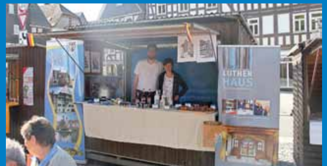
Der Infostand unserer Stadt war gut besucht