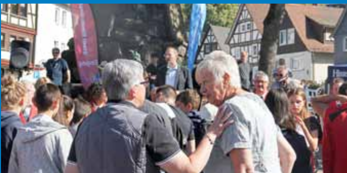
Reges Treiben auf dem Traditionsmarkt