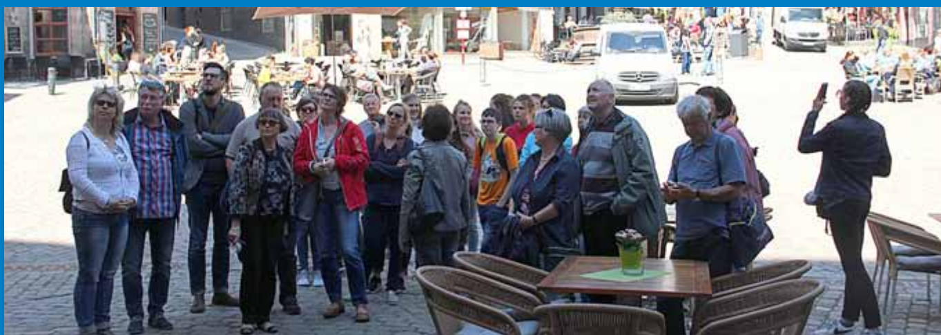
Gekonnt durch Marburg geführt verweilte die Reisegruppe im Schatten des Rathauses

am Geist von Europa und der gewachsenen Freundschaft jener fünf Städte mitwirken konnten. Am Samstagabend wurde bei einem geselligen Abend für alle Gäste trotzdem ein Sieger mit dem Wanderpokal gekürt, der aber ganz im freundschaftlichen Sinne dieses Jahr zwischen den Städten La Charité und Wepion aufgeteilt wird. Unsere Neu-