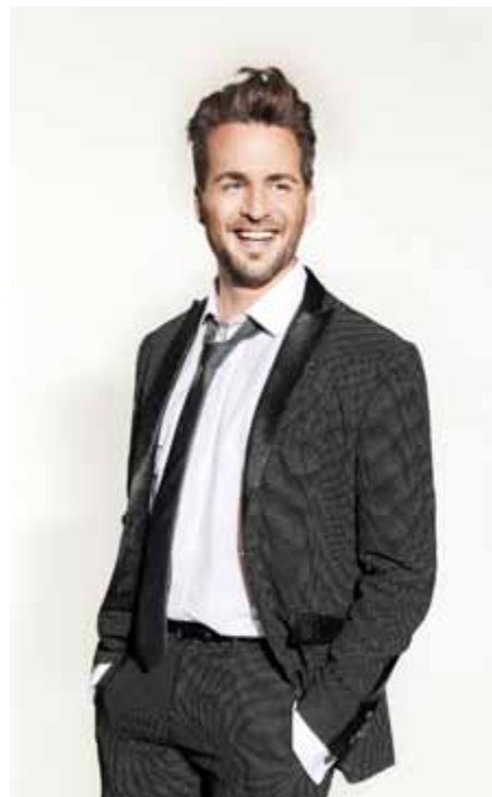
Alexander Klaws