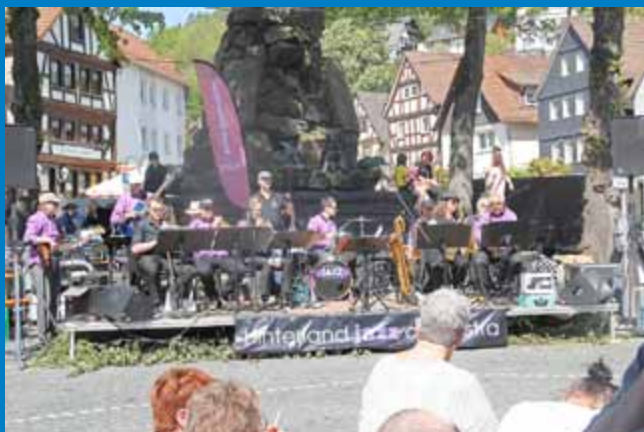
Das „Hinterland-Orchester“ begleitete das Markttreiben musikalisch