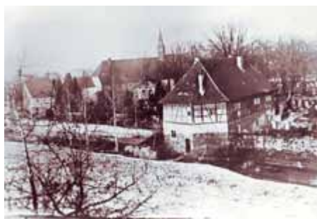
Siechenhaus mit Steg über den Siechenbach, im Hintergrund die Hospitalkirche

„9. [...] Früher hat der Gemeinderat die Zuleitung von Wasser nach dem Armenhaus einstimmig abgelehnt. Jetzt liegt ein erneutes, dringendes Gesuch des Hrn. Sattler vor. Nach den Ausführungen des Baubeamten mangelt es jetzt an Material, so daß es sich bei der Herstellung nur um einen Notbehelf handeln könne. Die Kosten sind auf 1000 Mk. veranschlagt, wenn die Leitung vom Leichenhause aus gelegt wird. Beschlossen wird, das Armenhaus an das Wasserrohrnetz anzuschließen. Die Mittel werden nachverwilligt. Gleichzeitig sollen auch die Rohre der Gasleitung in die Erde verlegt werden.“