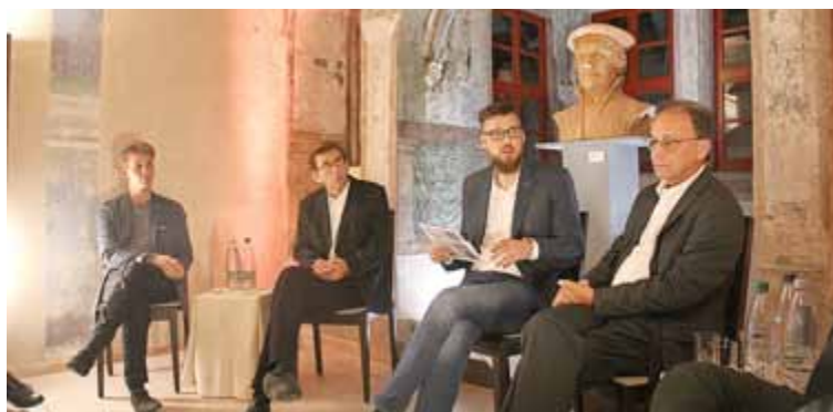
Der Gesprächsabend beleuchtete speziell die Frage nach: „Was bleibt?“ nach der Reformationsdekade