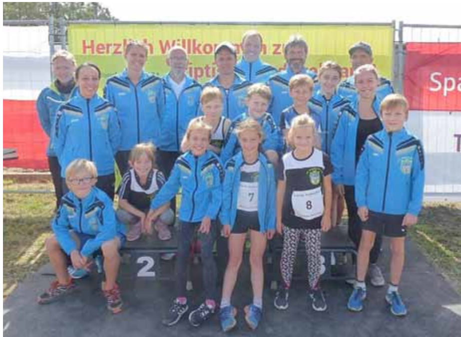
Die Teilnehmer des TSV „Germania 1887“ e.V. am 14. Triptiser Stadtwaldlauf