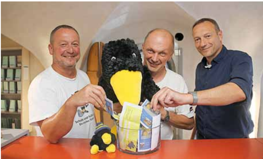
Das Maskottchen-Komitee war von der Vielzahl der Einsendung stark beeindruckt!

demokratischem Verfahren zur erneuten Abstimmung freigegeben. Hierzu musste die Anzahl der Einsendungen jedoch auf eine kleine Auswahl begrenzt werden. Berücksichtigt wurden dabei Mehrfachnennungen aber auch Zufallsauswahlen. Fünf der 138 kreativen, originellen und witzigen Ideen für einen Namen des Stadtmaskottchens, welches später zudem auf Drucksachen und anderen Souvenirs der Stadt erscheinen wird, sind nun zur öffentlichen Abstimmung freigegeben. Lassen Sie sich von den ausgewählten Namensvorschlägen der ersten Runde inspirieren und schreiben Sie uns Ihren Lieblingsnamen auf https://de-de.facebook.com/KulturstadtNeustadt/ oder nutzen Sie den unteren Abschnitt und reichen Sie Ihren Vorschlag in der TouristInfo im Lutherhaus oder im Briefkasten im Rathaus ein. Der Namensvorschlag mit den meisten Stimmen erhält den Zuschlag und ziert in naher Zukunft das Stadtmaskottchen Neustadts.