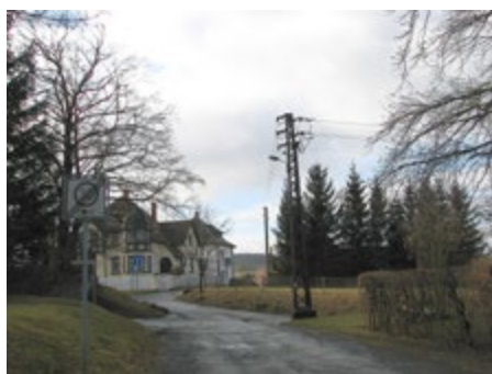
alte Straßenleuchte Ecke Arnshaugker Straße / Centbaumweg

Die Stadt plant eine weitere umfassende Umrüstung der Straßenbeleuchtung auf LED-Technologie. Im Fokus stehen vorerst 65 Lampen in den Ortsteilen Strößwitz,