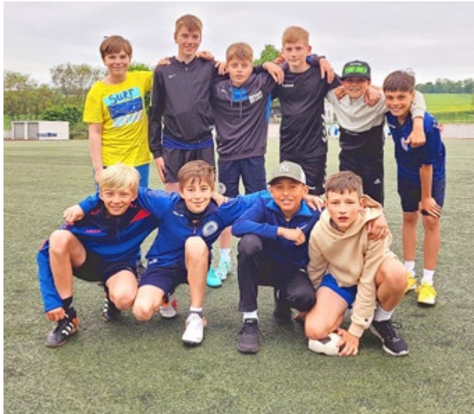
Endstand bei den Jungen: 1. Sportgymnasium Jena, 2. Goethe-Gymnasium Gera, 3. Orlatal-Gymnasium Neustadt, 4. Gymnasium Eisenberg, 5. Lerchenberggymnasium Altenburg.

den 3. Platz und scheiterte nur minimal an der Qualifikation für das Landesfinale.