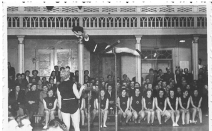
Turnerinnen in der Stadthalle 1959

Lassen Sie sich auf dieser Führung davon begeistern, wie viele verschiedenen Sportarten in unserer Stadt betrieben wurden und lernen Sie die Neustädter Vereine kennen, die es seit der Gründung des ersten Turnvereins gab.