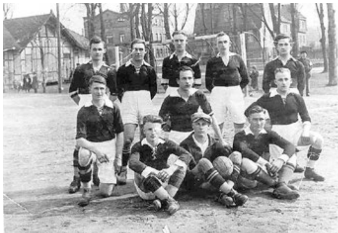
Fußballer auf dem Schützenplatz vor der Querbude ca. 1920er Jahre