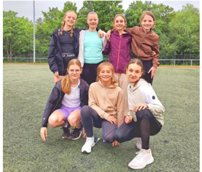
Die Mädchen des Orlatal-Gymnasiums belegten den 4. Platz. Endstand: 1. Sportgymnasium Jena, 2. Gymnasium Hermsdorf, 3. Goethe-Gymnasium Gera, 4. Orlatal-Gymnasium, 5. Lerchenberggymnasium Altenburg.