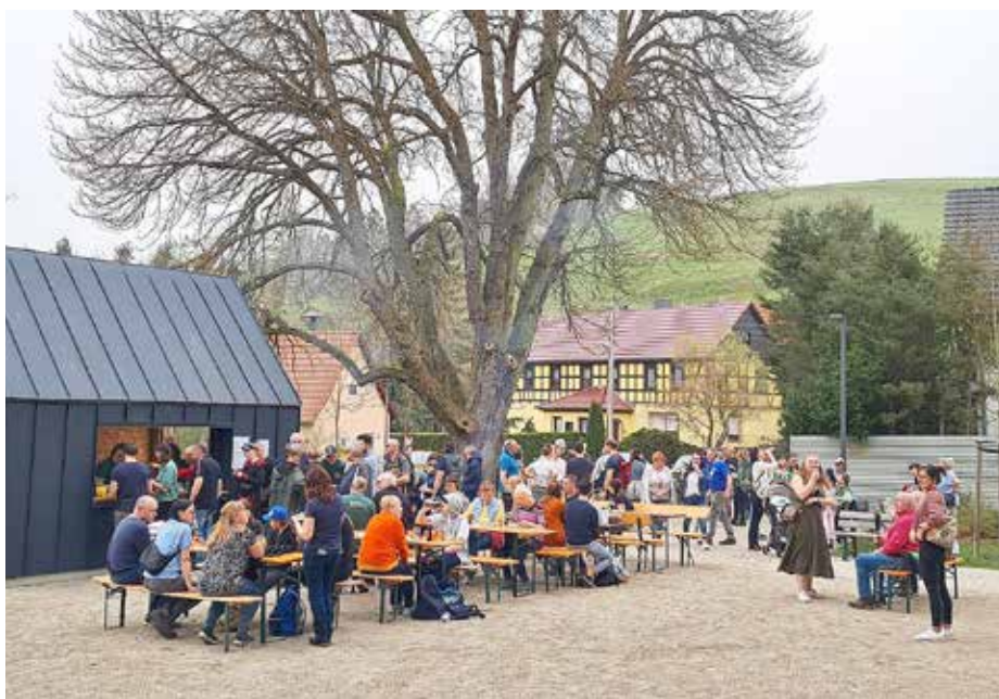
Abschluss auf dem Festplatz