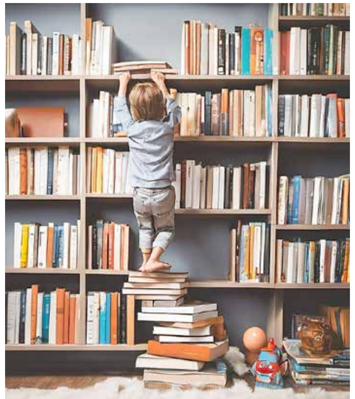
Ein riskanterer Weg zum Erreichen der Reckzone