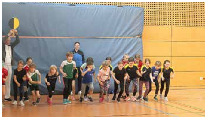
Start zum 3-Runden-Lauf der AK 10w

Lautstarke Unterstützung durch die zahlreich erschienenen Zuschauer erfreuten die Athleten über die 300m beziehungsweise 600 m Distanz. Jedem Teilnehmenden wurde zur Siegerehrung eine Urkunde übergeben.