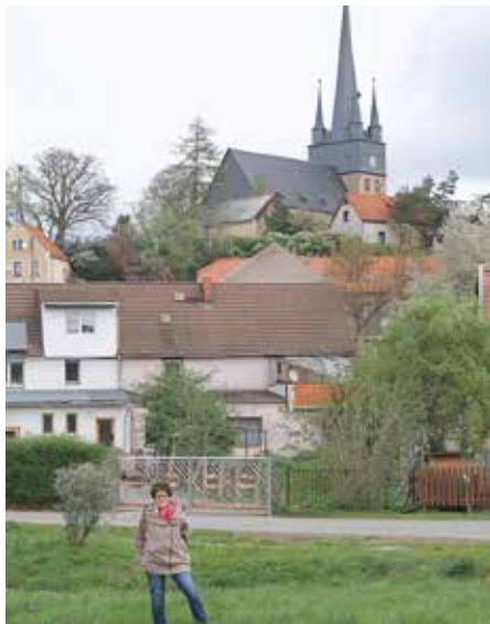
Neunhofen ist Startpunkt für die Führung durch den Mühlengrund

Unter dem Titel „Es klapperte die Mühle am rauschenden Bach“ findet am Samstag, den 4. Mai eine ganz besondere öffentliche Stadtführung durch den Mühlengrund bei Neunhofen statt, die in doppelter Hinsicht zu neuen Sichtweisen auf die reizvolle Landschaft dieses Durchbruchstals führen dürfte.