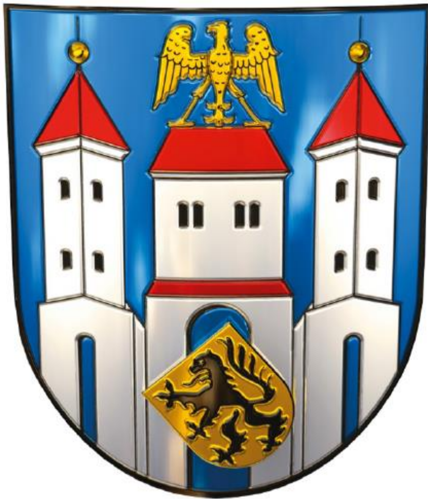
Anlage 2: Karte der Gemarkung Neustadt an der Orla