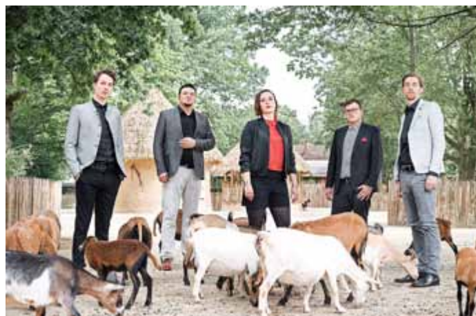
Ob im Ziegenstall...

Nähere Informationen zum Konzert im AugustinerSaal sowie das vollständige MusikSommer-Programm und Karten für die Veranstaltung erhalten Sie unter musiksommer.neustadtanderorla.de oder unter Tel.: 036481 85 121 sowie in der TouristInformation im Lutherhaus.