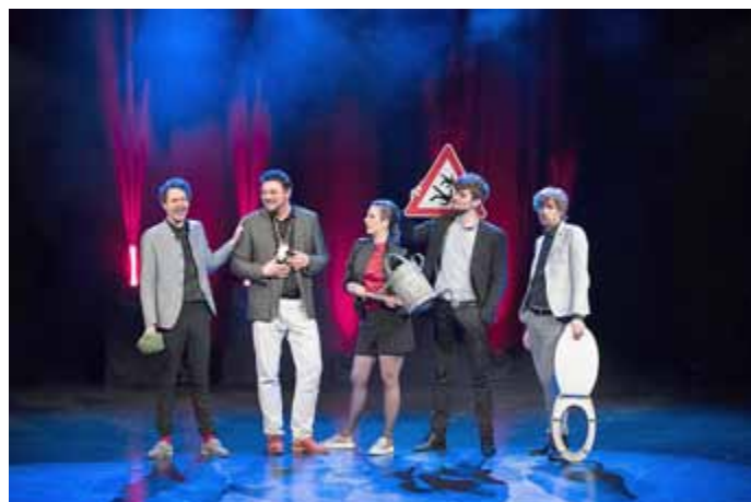
... oder auf der Bühne! Bei der HörBänd ist das Programm Programm.