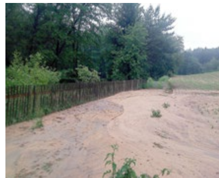
Bodenerosion nach Starkregen

In landwirtschaftlichen Flächen Deutschlands werden ca. 2,4 Milliarden Tonnen Kohlenstoff (entspricht 8,8 Mrd. Tonnen CO2) gespeichert. Das ist ungefähr die dreifache Menge an freigesetztem Kohlenstoff in der Bundesrepublik Deutschland im Jahr. Ackerböden haben die Speicherkapazität von ca. 95 t/ha, humusreiche, trockengelegte Moorflächen liegen hier bei über 1000 t/ha. (Quelle: Bundesinformationszentrum für Landwirtschaft, Wie viel CO2 binden Böden?)