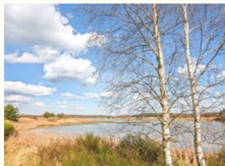
Land der Tausend Teiche

„Gefördert vom Bundesministerium für Wirtschaft und Klimaschutz aufgrund eines Beschlusses des Bundestages“.