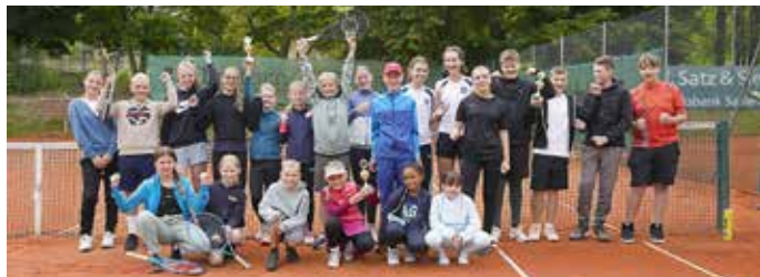
Teilnehmerfeld des 14. Teenie-Tennis-Turnier des TC94 mit Spielern aus Lobenstein, Schleiz, Zeulenroda und Neustadt an der Orla

Am 23. August fand unser 14. Teenie-Tennis-Turnier des TC94 Neustadt an der Orla statt, dieses Jahr wie im Vorjahr als Kreisjugendspiele im Tennis des Saale-Orla-Kreises. Eingeladen waren Tennisspieler und Tennisspielerinnen zwischen 5 und 17 Jahren aus allen Schulen des Landkreises und von den Vereinen aus Pößneck, Saalfeld, Bad Lobenstein, Schleiz, Zeulenroda und Neustadt.