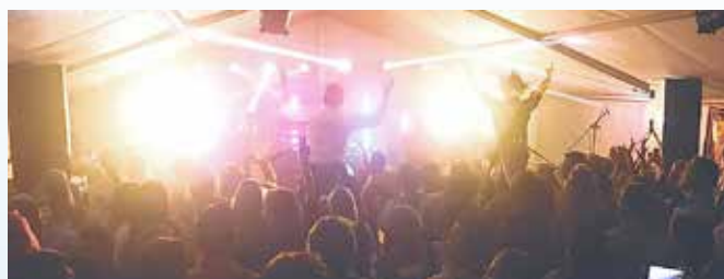
Sorgen für Stimmung im Festzelt: die Partyband Spur 13 und weitere Programmhilights; Foto: Spur 13

15 Uhr wird zu „1,2,3 - Bühne frei!“ ins Festzelt eingeladen. Dazu kann gern eine Tasse Kaffee oder Kakao und leckerer Kuchen genossen werden. Die herzhafte Versorgung übernimmt am Samstag M&M Catering aus Dreba. Um 20 Uhr beginnt der große Partyabend mit der Band „Spur 13“, sowie Showeinlagen der Tanzgruppen vom CCM und den Molbitzer Eintänzern.