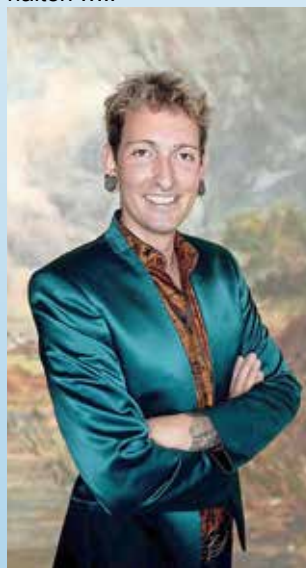
Fabian Kahl, bekannt aus „Bares für Rares“, wird mit seinem Bruder Tobias die Raritäten der Gäste schätzen - und so manche auch ankaufen.