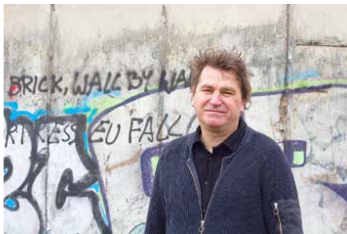
Der Autor und Publizist Ilko-Sascha Kowalczuk

So formuliert er: der Westen mag sich seinen Osten „erfunden“ haben. Doch auch der Osten erfand und erfindet sich seinen Westen. In der DDR war der Westen für viele ein Sehnsuchtsort, doch auch die antiwestliche Propaganda der SED hatte weit zurückreichende Wurzeln. Sie wurden durch die Frustrationen des Vereinigungsprozesses verstärkt. Und sie hindern jetzt viele Ostdeutsche daran, sich die liberale Demokratie der Bundesrepublik zu eigen zu machen.