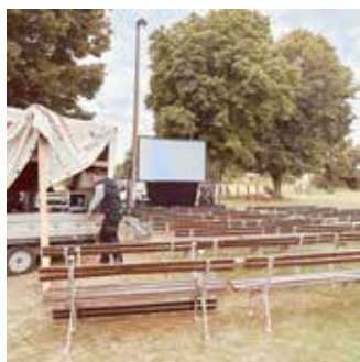
Der Neunhofener Sportplatz verwandelt sich in einen Open-Air-Kinoplatz.

Kino funktioniert auch auf dem Sportplatz. Das konnte am 22.8. in Neunhofen erlebt werden. Passend zur Spielstätte wurde die gleichnamige Filmbiografie des Ausnahmetorhüters Bernhard Trautmann gezeigt. Den eher an Herbst statt lauer Sommernacht erinnernden Temperaturen zum Trotz, zog es fast 100 Zuschauer in das „Stadion zum fröhlichen Maulwurf“, wie der Platz auch liebevoll bezeichnet wird. Mit dicken Jacken und Decken waren sie bestens ausgestattet und genossen Kinoatmosphäre dort, wo sonst eigentlich