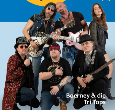
Boerney & die Tri Tops