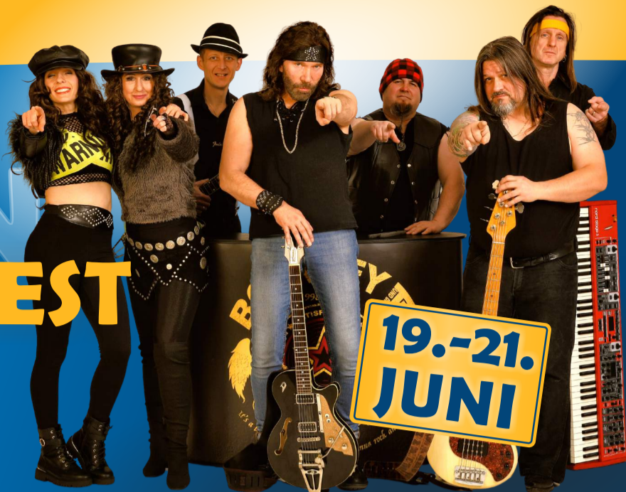
© Boerney & die Tri Tops