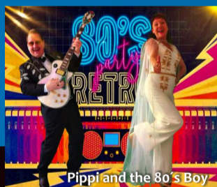
Pippi and the 80's Boy