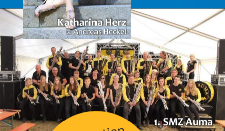
1. SMZ Auma

Moderation Tagesprogramm: Hendrik Püschel Sa + So