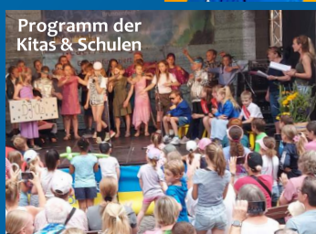
Programm der Kitass & Schulen