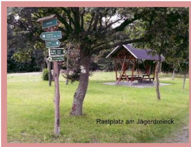
Rastplatz am Jägerdreieck